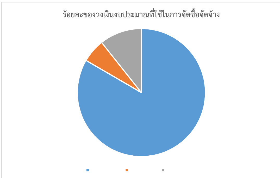
ร้อยละของวงเงินงบประมาณที่ใช้ในการจัดซื้อจัดจ้าง